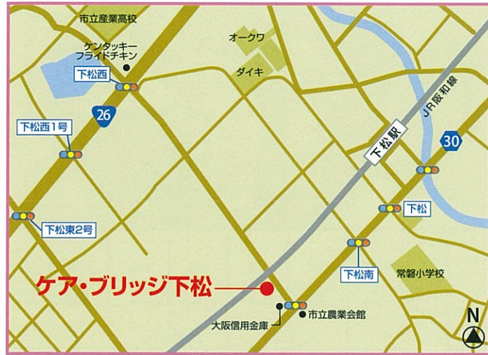
JR阪和線「下松」駅から徒歩8分