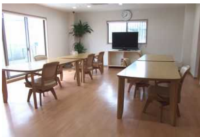
ゆったりとした食堂