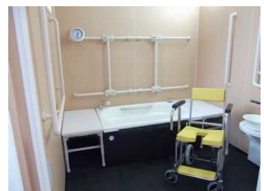
ムム浴槽で楽しく入浴