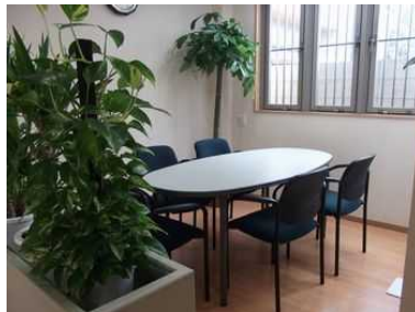
来客とのコミュニティスペース