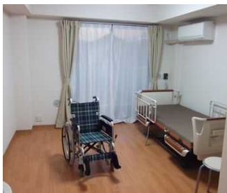
ベッドを置いても余裕の18㎡