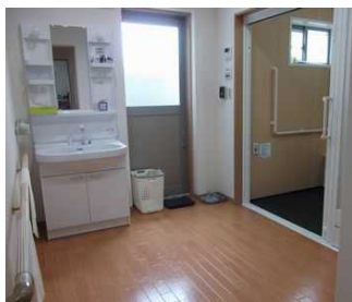
十分なスペースを確保(脱衣場)