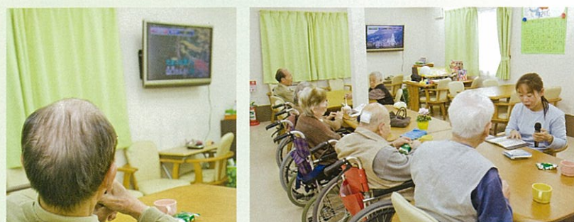
カラオケ大会をはじめ、生活を彩る楽しいレクリエーションも定期的で開催。ご入居様同士の親睦も深まります。