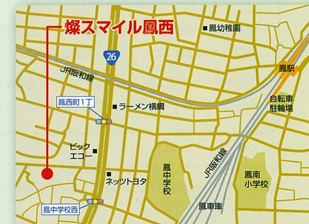
交通手段 / JR 阪和線「鳳」駅から徒歩約15分