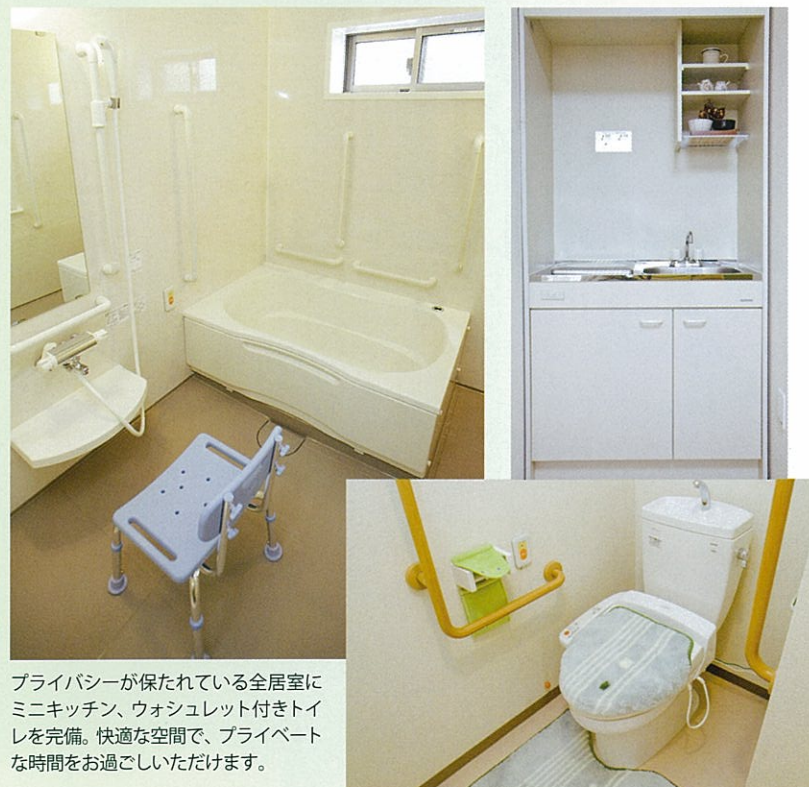
プライバシーが保たれている全居室にミニキッチン、ウォシュレット付きトイレを完備。快適な空間で、プライベートな時間をお過ごしいただけます。

季節のイベントや、講師を招いてのスクールなどを開催。ご要望に応じて、スタッフがイベントを企画いたします。