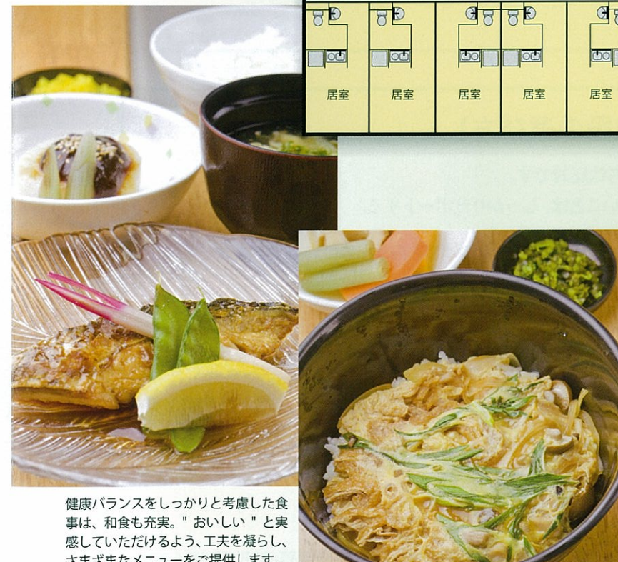
健康バランスをしっかりと考慮した食事は、和食も充実。“おいしい”と実感していただけるよう、工夫を凝らし、さまざまなメニューをご提供します。