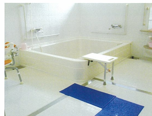
▲大きなお風呂でゆったりとくつろぎませんか？