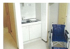
▲居室は便利なミニキッチン付き。