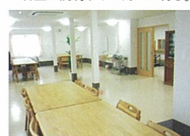
▲大きく明るい食堂で楽しくお食事。