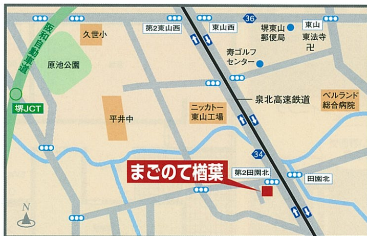
まごのて 檜葉 堺市中区檜葉30番地1号