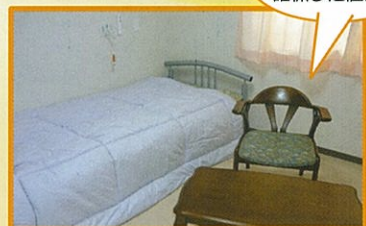
プライバシーを確保した居室