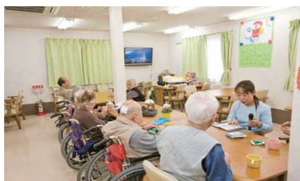
食堂兼コミュニティスペース レクやゲームも盛りだくさん！