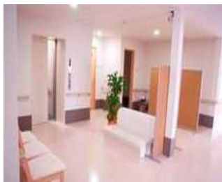
2階でもゆったり！ 広々談話スペース