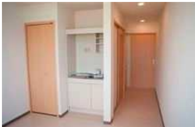
ミニキッチンと収納もあります。