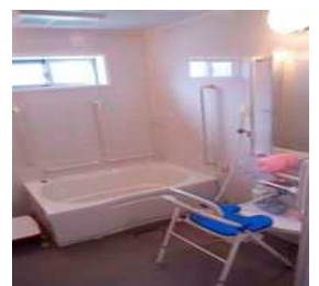
個浴も完備 ゆったりと入浴できます