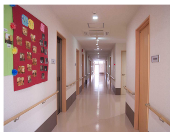
車イス同士でも ゆったりと通れる広々ローカ